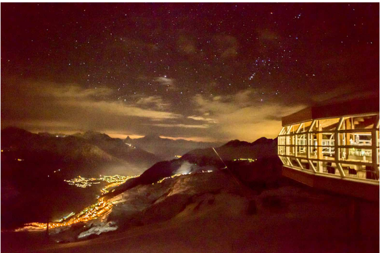
Restaurant Bettmerhorn, unten Bettmeralp und Brig. Die Kulisse ist mit oder ohne Sterne atemberaubend, weit hinten stupt das Matterhorn aus dem Horizont.