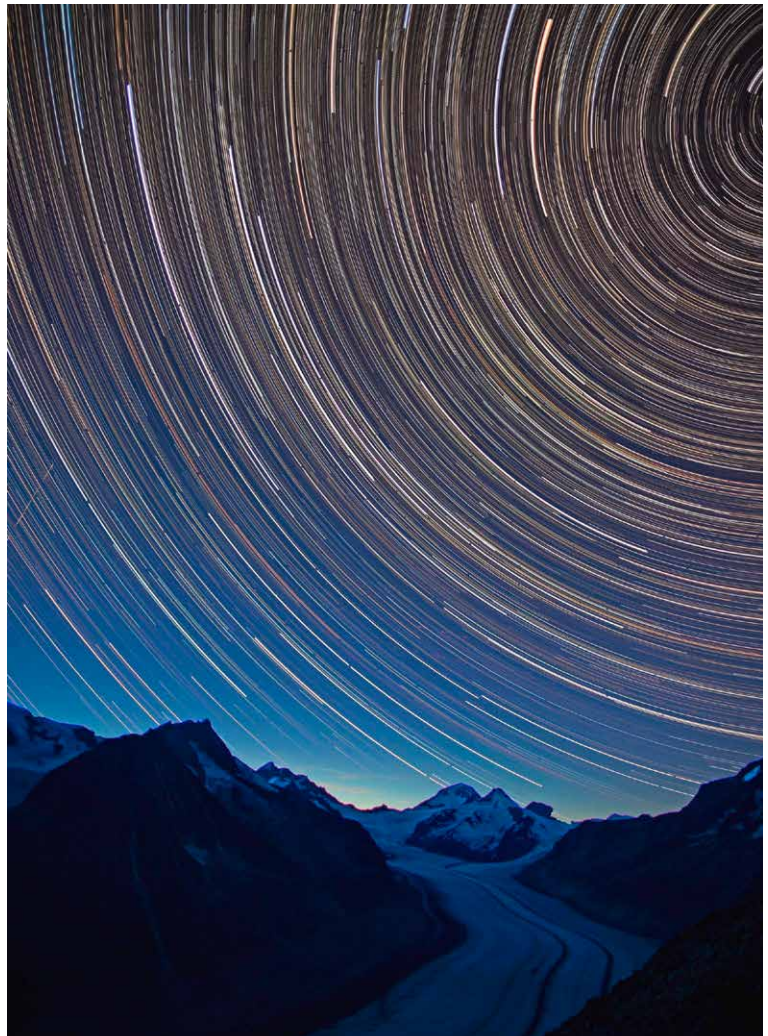
Bei klarem Himmel sind solch spektakuläre Bilder möglich. Das Foto entstand auf dem Eggishorn, wo ebenfalls Chasing-Stars-Workshops stattfinden.