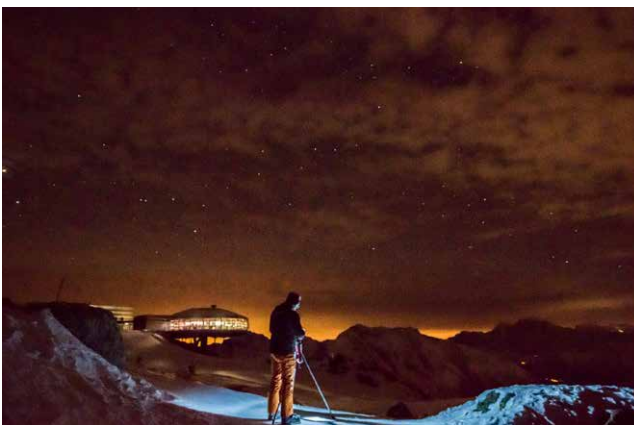
Workshop-Teilnehmer Wolfgang Zettler.