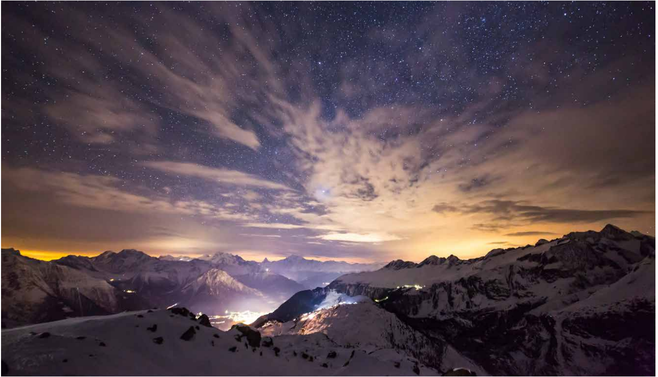
Nach der Blauen Stunde wirds wieder hell, dank guter Sensoren und Objektive.