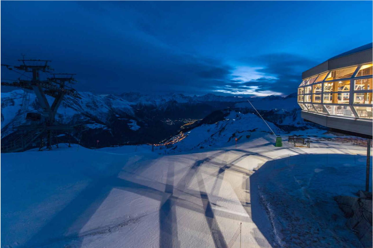
Restaurant Bettmerhorn in der Blauen Stunde. Tief unten Bettmeralp und hinten Brig.

H och über der Bettmeralp werde ich mit meinem schweren Gepäck aus der 8er-Seilbahn gespuckt. Das angrenzende Restaurant Bettmerhorn gleicht einem aufgesetzten Ufo, als seien die Extraterrestrier eben kurz den Aletschgletscher besuchen.