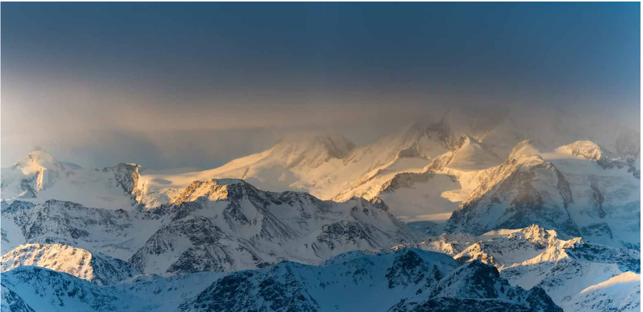
Allalinhorn (Mitte, 4027 m) und Dom (rechts, 4545 m) werden unter den Wolken vom Licht gestreichelt.