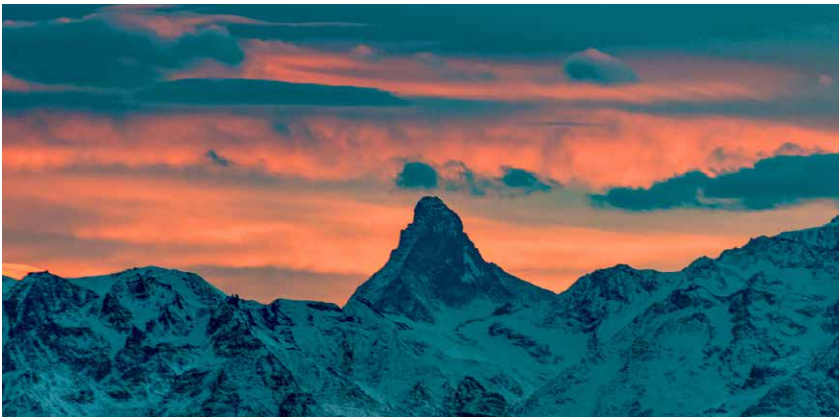
Nachglühen vor der Blauen Stunde.