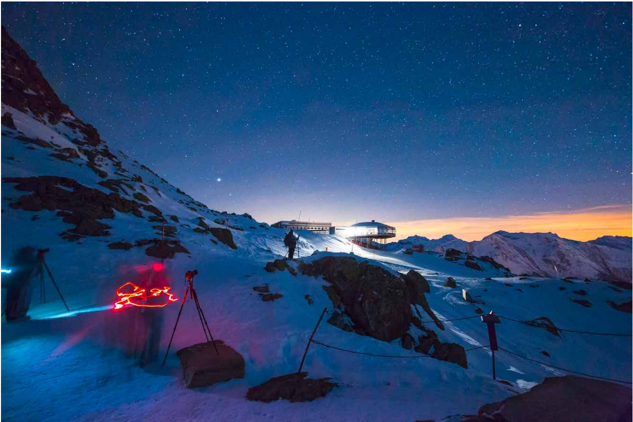
Restaurant Bettmerhorn von der Aussichtsplattform über dem Aletschgletscher her gesehen.