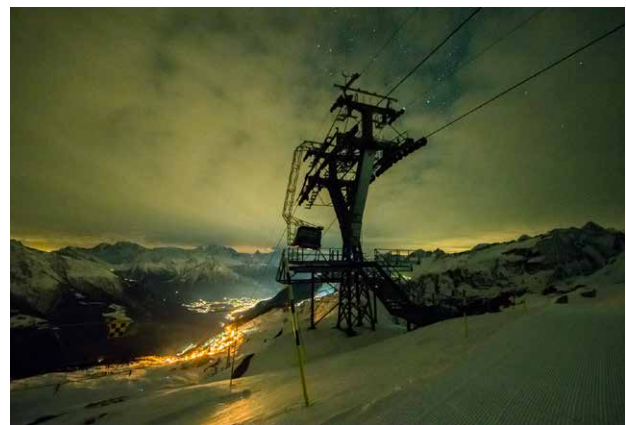
Um ein Uhr nachts herrscht hier oben nur Stille.