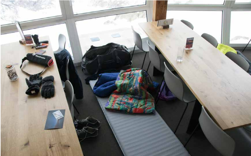
Das Nachtlager im Restaurant Bettmerhorn: Schlafmatte, Schlafsack zwischen den Tischen – drei bis fünf Stunden Schlaf liegen höchstens drin.

Vordergrund, wir sollen einfach das nötige Rüstzeug erhalten, um spektakuläre Nachtaufnahmen zu machen.