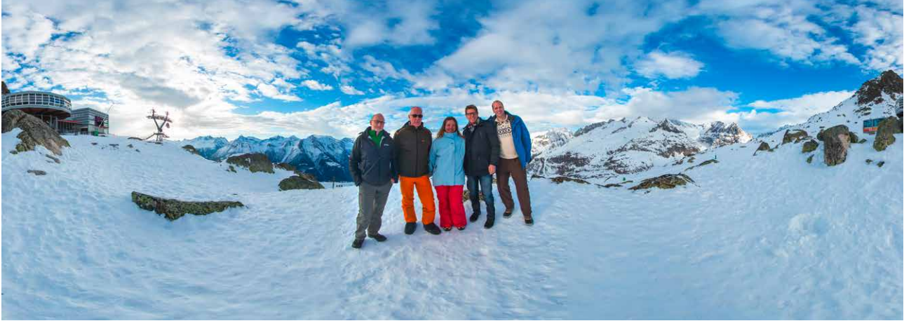
360-Grad-Sicht mit 8-mm-Objektiv, 4 Aufnahmen im 90-Grad-Winkel, anschl. zusammengerechnet.