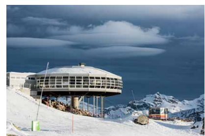
Restaurant Bettmerhorn, ein gelandetes Ufo?

Später sitzen wir bei Kaffee, warmer Schokolade und einem frischen Buttergipfeli und schwatzen über das Erlebte. Wie wenig es doch braucht, eine kleine verschworene Gemeinschaft zu bilden. Es hat sich für alle gelohnt, wir sind voller Eindrücke und gespannt, was aus dem Shooting wohl resultieren wird. Dann poltern die ersten Skifahrer rein entreissen uns «unser» Restaurant.