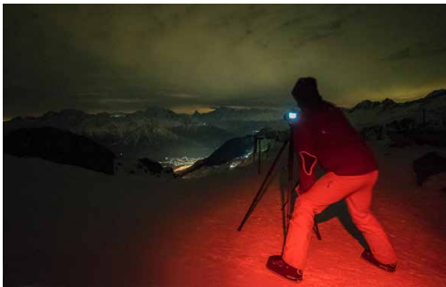
Das Rotlicht der Stirnlampen erzeugt magische Momente.