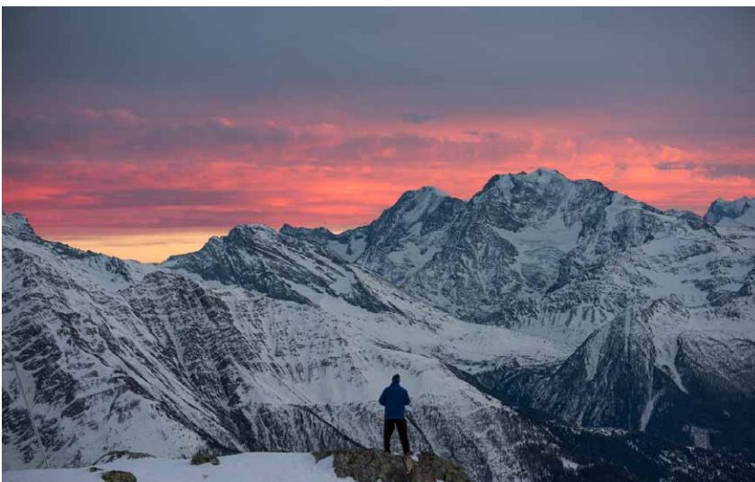
Markus Eichenberger in Action.