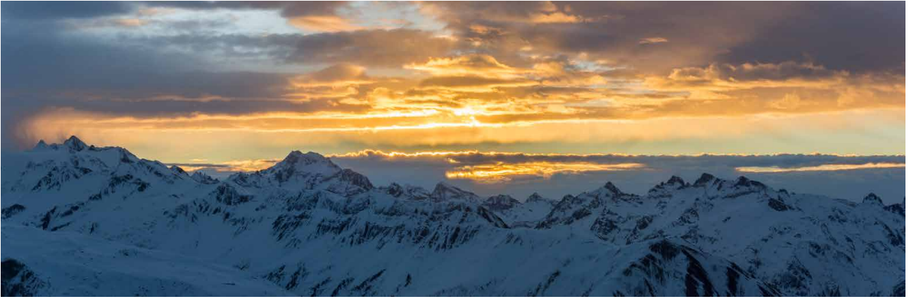
Der Sonnenaufgang vom Bettmerhorn ist schlicht atemberaubend.