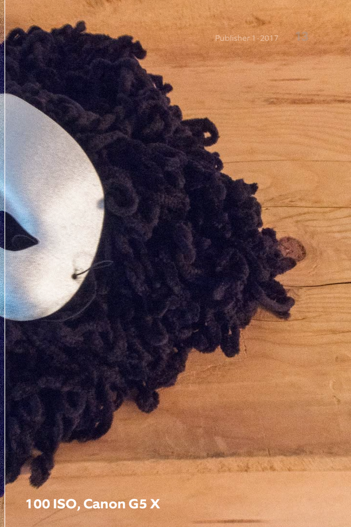
100 ISO, Canon G5 X

der Landschaft. Das Luminanz-Bildrauschen (Helligkeit) macht sich als Körnigkeit bemerkbar, das chromatische Bildrauschen tritt als Farbstörung auf. JPEG-Bilder verhalten sich bezüglich Farbe innerhalb der verschiedenen ISO-Einstellungen konstant neutral. RAW-Bilder zeigen ein anderes Verhalten. Bei der Entwicklung in Lightroom werden die schwarzen Tiefen (in der Perücke) bläulich «gepusht». Bei hohen ISO-Werten gibt es Nachteile, eine natürliche Farbwiedergabe ist erschwert und die Schärfe leidet. Je kleiner der Sensor bzw. die Pixel, desto stärker ist dieser Effekt. Die partielle Entsättigung einer solchen Farbstörung mittels Photoshop ist zwar möglich, aber wohl nicht jeder-