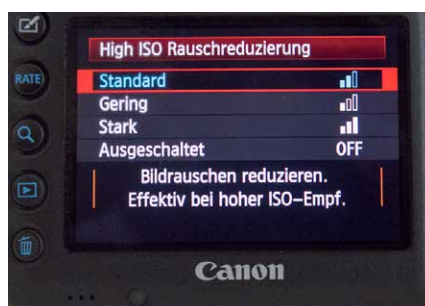
Bei (fast) jeder Kamera kann das Rauschen in hohen ISO-Bereichen reduziert werden. Hier die Canon EOS 5D Mark III.