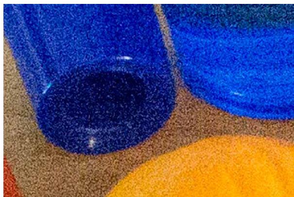
Die Abbildung oben links in der Vergrößerung, oben ohne Rauschreduzierung, unten mit Standard-Rauschreduzierung. Im Ergebnis ist kein Unterschied auszumachen.