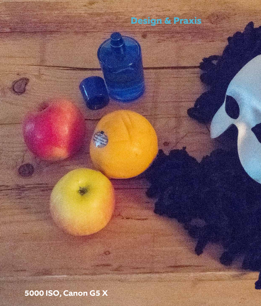
5000 ISO, Canon G5 X