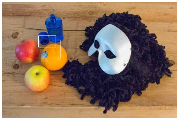
Canon EOS 5D mit 20 000 ISO fotografiert, f16, 1/8 Sek., mit Stativ. Die Originalgröße lässt eine Größe von 27 × 18 cm bei 300 ppi zu. Die Abbildung hier ist also mehr als dreimal verkleinert wiedergegeben. Je kleiner die Abbildung, desto mehr «verschwindet» das Bildrauschen.