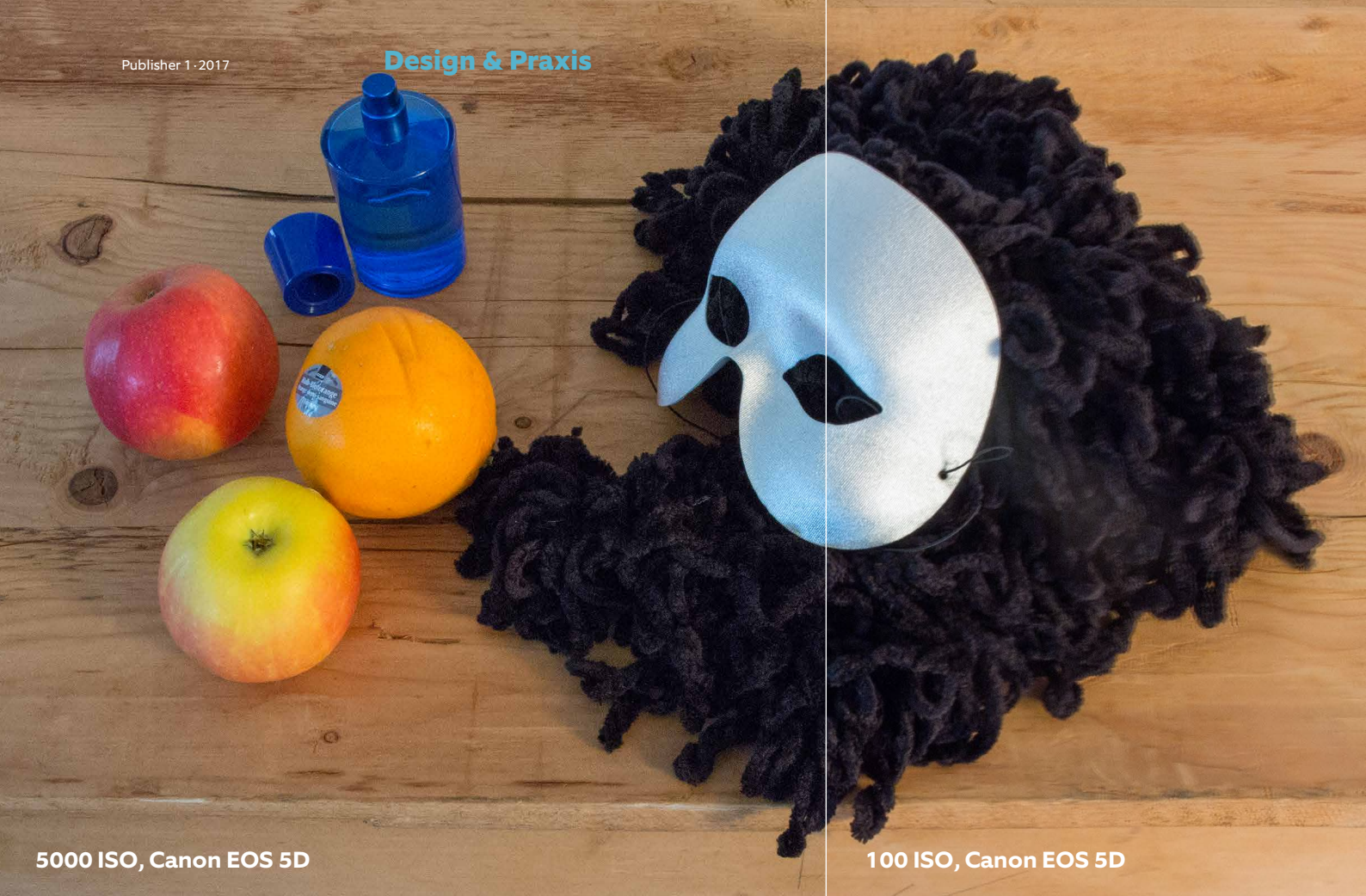
5000 ISO, Canon EOS 5D