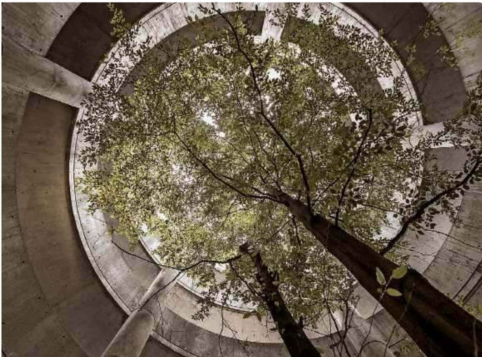
Wie eine Ruine im Regenwald mutet diese Szenerie im Parkhaus Hardturm an.