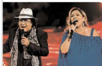
Konzert: Comeback von Al Bano & Romina Power.